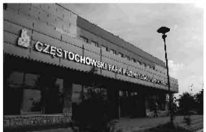
Nowy obiekt Częstochowskiego Parku Przemysłowo-technologicznego

Miasto powołało Agencję Rozwoju Regionalnego. Dzięki temu zrealizowano projekt Częstochowskiego Parku Przemysłowego powstały w pełni dozbrojone 4 hale dla przedsiębiorców oraz Centrum Transferu Technologii z inkubatorem przedsiębiorstw na ul. Wały Dwernickiego. Koszt tworzenia tej bazy przekroczył 20 mln zł. Z różnych form pomocy ARR skorzystało ponad 1000 przedsiębiorców. Aktywne formy przeciwdziałania bezrobociu stosowane przez Powiatowy Urząd Pracy pomogły w założeniu ok 300 nowych podmiotów gospodarczych. Urząd Miasta wdrożył także program pomocy przedsiębiorcom, przewidujący ulgi za tworzenie nowych miejsc pracy. Z opłaty za wpis do ewidencji zwolnione są osoby rejestrujące w urzędzie małe firmy. Duże inwestycje były pilotowane przez pracowników Urzędu, stąd decyzja TRW o rozwoju zakładów i zwiększeniu zatrudnienia o 1100 osób (w okresie 2007-2008).