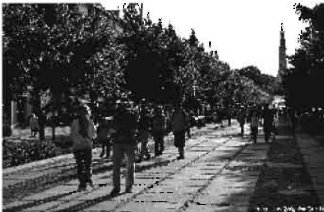
Zakończona inwestycja w III Alei Najświętszej Maryi Panny